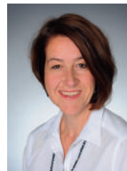
Projektleiterin im Zentrum für Palliativmedizin, Uniklinik Köln