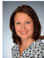
Projektmitarbeiterin im Zentrum für Palliativmedizin, Uniklinik Köln

Gründungsmitglied mit langjähriger Erfahrung als Pädagogische Leiterin bei TrauBe Köln e. V. – TrauerBegleitung für Kinder, Jugendliche und junge Erwachsene, Sterbebegleiterin, Dozentin, Publikationen von Fachbeiträgen, Diplomkauffrau, Psychologische Beraterin IAPP, Trauerbegleiterin BVT.