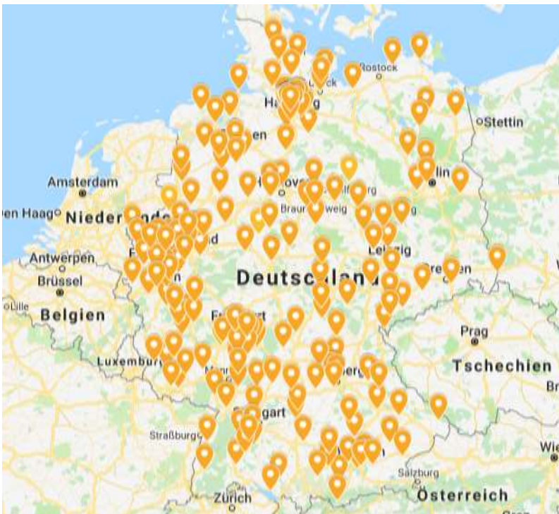
→ Karte zum WHT 2019 / Stand 14.08.2019

Besonders sichtbar wurde die große Zahl der teilnehmenden Hospizdienste und -einrichtungen in den letzten Jahren durch eine Übersicht, die in Form einer Karte / Map auf der Homepage des DHPV eingestellt war. Diese Karte möchten wir auch in diesem Jahr wieder einpflegen – nicht zuletzt um die Vielzahl und die Vielfalt der Hospizbewegung in Deutschland zu zeigen. Alle Einrichtungen / Dienste, die Material bestellen, werden automatisch auf die Karte aufgenommen. Wir freuen uns aber auch darüber hinaus über Hinweise auf geplante Veranstaltungen (Mail an k.nuechter@dhpv.de ) und nehmen diese gerne in die Übersicht auf. Zudem haben Sie die Möglichkeit, Ihre Veranstaltung selber einzutragen (hierzu müssen Sie sich mit einem Google-Konto anmelden).