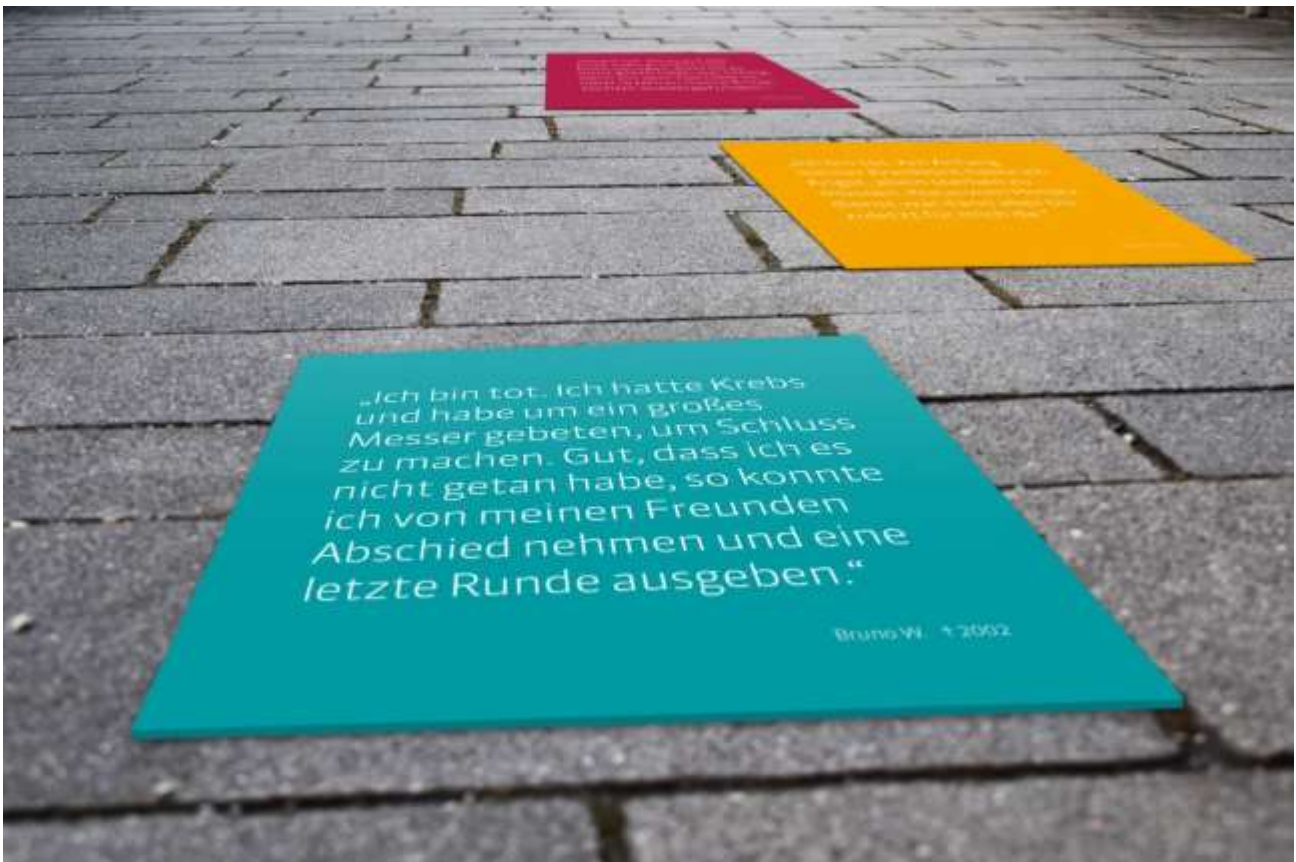
Modellansicht auf Straßenpflaster

Die Bodenplanen sind im Format 1 x 1 Meter angelegt. Sie sind UV-beständig und wetterfest (wir haben den Wasser- und Schmutzschuhtest gemacht 😊) und können auch weit über den Welthospiztag hinaus genutzt werden. Sie sind unter normalen Schuhen nicht rutschig, der Rand passt sich gut an den Untergrund an, wir empfehlen trotzdem eine Fixierung mit Gaffa Tape o.ä.